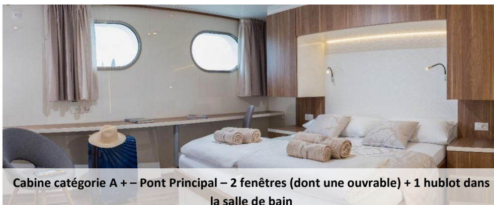
Cabine catégorie A + – Pont Principal – 2 fenêtres (dont une ouvrable) + 1 hublot dans la salle de bain