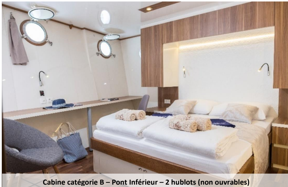
Cabine catégorie B – Pont Inférieur – 2 hublots (non ouvrables)

Le linge de toilette (1 grande serviette et 1 petite serviette) est fourni et changé 1x par semaine, une serviette de bain est également fournie mais ne sera pas changée.