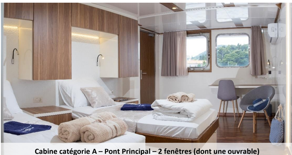
Cabine catégorie A – Pont Principal – 2 fenêtres (dont une ouvrable)